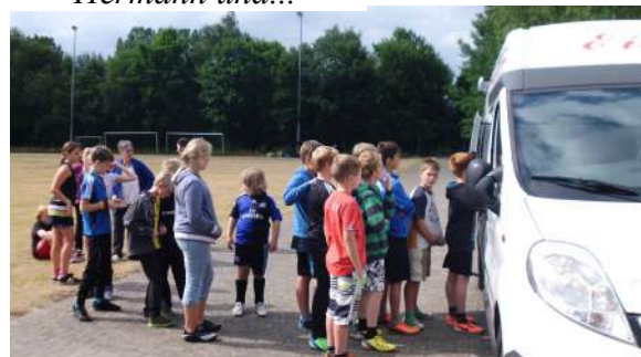
Anstehen für ein Eis....