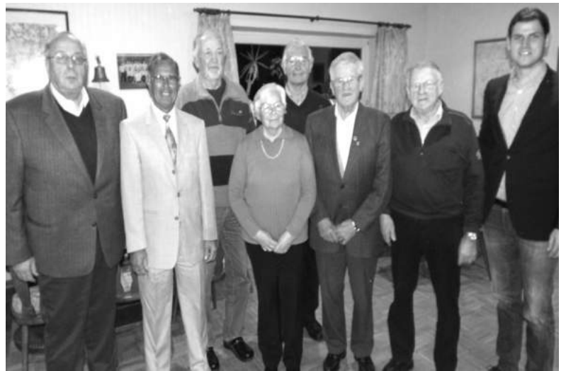
Ehre wem Ehre gebührt! Auf der Jahreshauptversammlung 2014 wurden wieder verdiente Vereinsmitglieder geehrt.