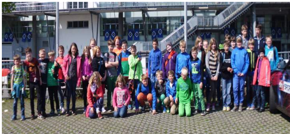
Das Team vor dem HSV-Stadion in Hamburg

Im Juni nahmen wir mit zwei Mannschaften am Turnier in Tönning teil und erreichten den 12. und 5. Platz.